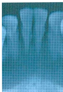
ب) رادیوگرافی پری‌آپیکال نیمساز

گردید و این اعداد برای مزایا و دیستال هر دندان ثبت شد (در کل ۱۲ عدد برای هر بیمار). حدود ۱ هفته بعد، بیماران مورد عمل جراحی لثه (flap surgery) قرار گرفتند. بعد از کنار زدن بافت توسط الواتور پریوست، فاصله بین CEJ تا قله کرسر آلوتولار در دو ناحیه مزایا و دیستال هر دندان با استفاده از پروب ویلیامز (Williams, Hu Fridley, USA) با دقت ۱ میلی‌متر اندازه‌گیری شد و نتایج به صورت جداگانه ثبت گردید. در نهایت، اطلاعات به دست آمده توسط نرم افزار SPSS و با استفاده از آزمون آماری Paired t-test مورد تجزیه و تحلیل قرار گرفت. معنی‌داری آماری همه آزمون‌ها در p \text{ value} > ۰/۰۵ تعیین شد.